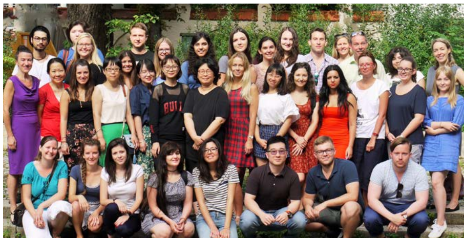
Erster Kurstag für die TeilnehmerInnen der Munich International Summer University (MISU)