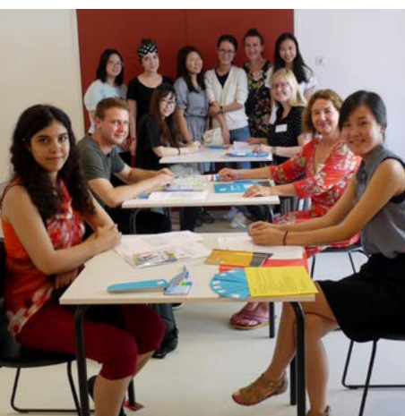
Welcome Reception: Ankunft in München