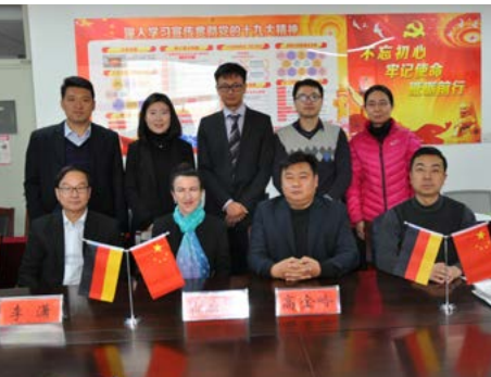
Vertragsunterzeichnung an der Shandong Jianzhu University

Anlässlich der Reisen zu Hochschulmessen in China und Vietnam im Dezember 2017 konnten neue Partnerhochschulen gewonnen werden. Mit der Shandong Jianzhu University und dem South China Business College (Guangzhou) zählen ab 2018 zwei hochrangige chinesische Institute zu den Kooperationspartnern der Deutschkurse . Die Studenten werden an einem achtmonatigen Langzeitprogramm „Deutsch lernen in München“ teilnehmen.