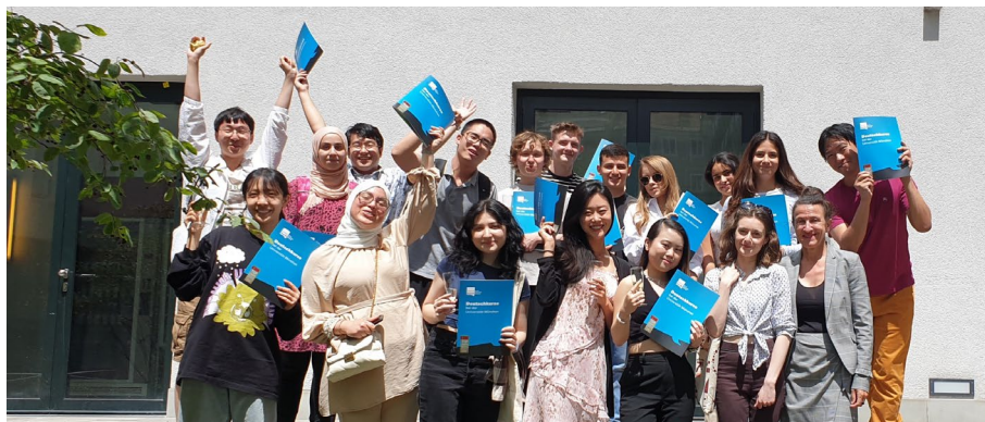
Das Zertifikat in der Hand: Glückliche Absolventinnen und Absolventen der DSH freuen sich auf ihr Studium in Deutschland.

Viele internationale Studieninteressierte haben ein großes Ziel: Sie wollen die Deutsche Sprachprüfung für den Hochschulzugang (DSH) bestehen, um in Deutschland zu studieren oder eine berufliche Karriere zu starten. Die Prüfung ist anspruchsvoll und erfordert einiges an Lerndisziplin. Doch es lohnt sich: Die DSH öffnet die Tür zu Studium und Beruf. Neun Mal pro Jahr führt das Institut die DSH im Auftrag der Ludwig-Maximilians-Universität München durch.