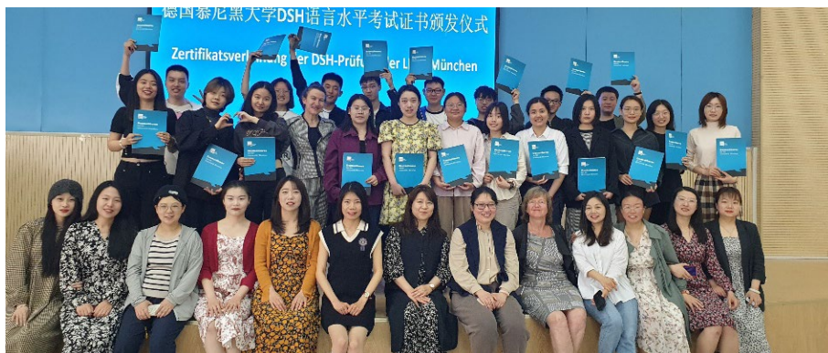
Studierende in Qingdao mit ihrem DSH-Zertifikat an der UPC

Ergänzend zur DSH in München bieten die Deutschkurse an der Partneruniversität UPC (China University of Petroleum) in Qingdao seit 2016 auch eine Fern-DSH an. Es ist eine der wenigen DSH-Prüfungen im Ausland. Im Mai 2023 konnten erstmals seit vier Jahren wieder Studieninteressierte vor Ort geprüft werden.