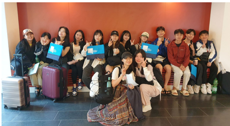
Studierende aus Korea bei der „Welcome Reception“