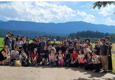
Exkursion nach Schloss Linderhof und zur Wieskirche