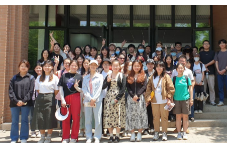
Tianjin Sino-German University of Applied Sciences