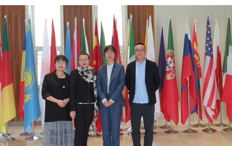
Jilin International Studies University, Changchun