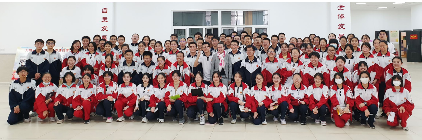
Die erste Deutschstunde für die Schüler/innen der Datong No. 1 High School