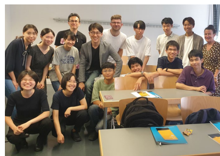
Studierende der University of Tokyo (Todai) aus Japan am ersten Kurstag