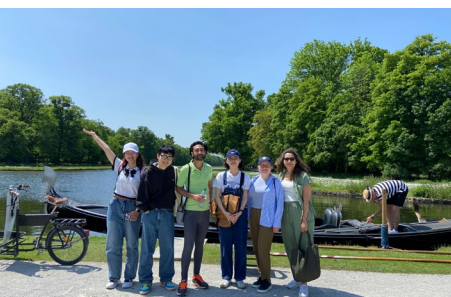
Nicht in Venedig, ... sondern im Schlosspark Nymphenburg