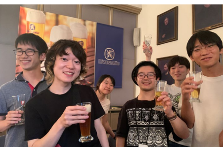
... mit Bier-Verkostung