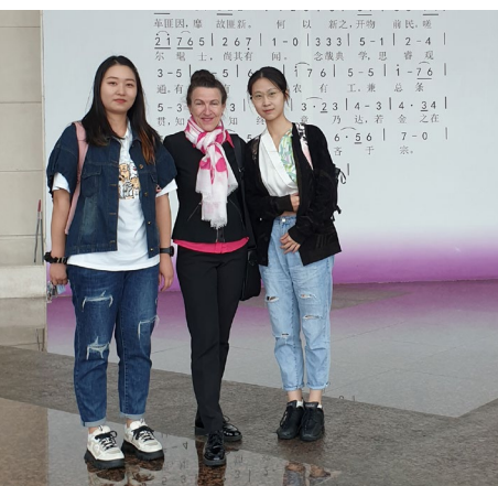
Zhejiang University, Hangzhou