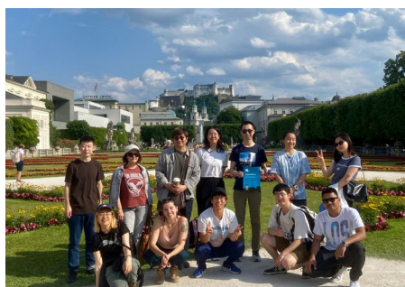
Tagesausflug nach Salzburg