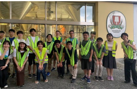
Besuch einer Münchener Brauerei

Die Studierenden kamen aus der ganzen Welt nach München. Vor allem bei japanischen und koreanischen Studieninteressierten war die Nachfrage groß.