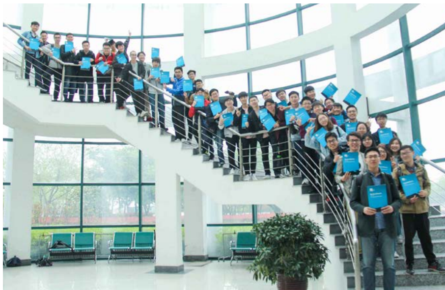
Fern-DSH an der China University of Petroleum (UPC) in Qingdao Studenten nach der Zeugnisverleihung auf der großen Freitreppe