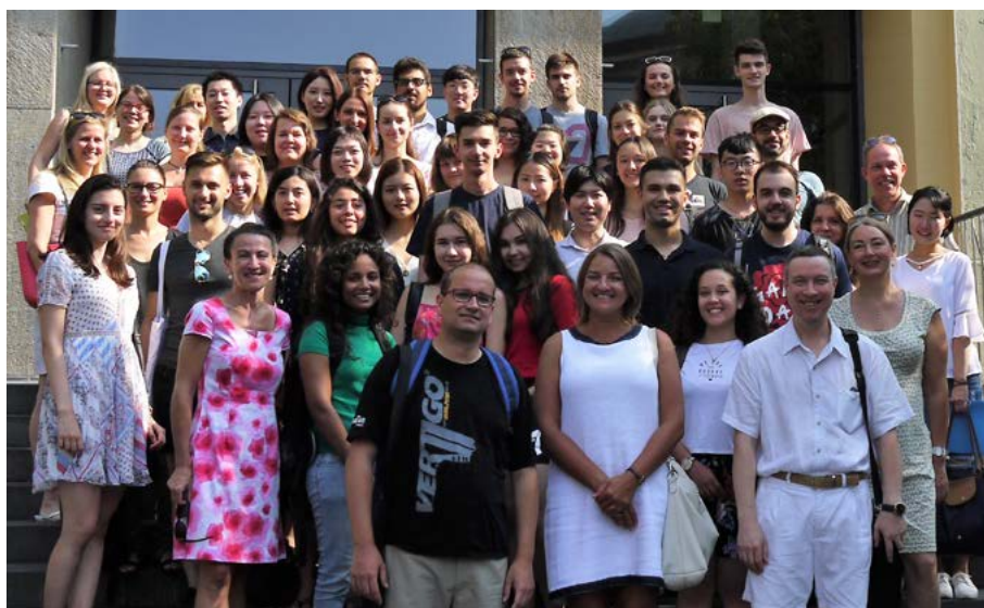
Welcome Lecture für die MISU-Sommerkurse (Munich International Summer University) Erster Kurstag vor dem Pettenkofer-Gebäude