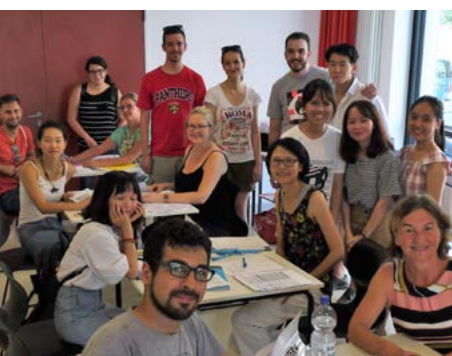
Welcome Reception MISU Ankunft bei den „Deutschkursen“