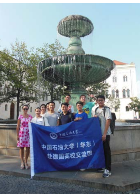
China University of Petroleum Qingdao Delegation im August am Geschwister-Scholl-Platz der LMU

2019 gilt es nun an die vielversprechenden Reisen anzuknüpfen und die Vereinbarungen mit den neuen Kooperationspartnern mit Leben zu füllen.