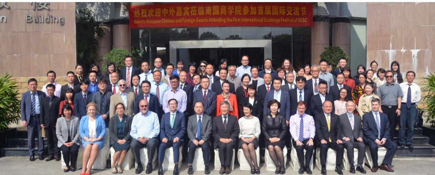
Gruppenfoto anlässlich des First International Exchange Festivals des South China Business Colleges der Guangdong University of Foreign Studies