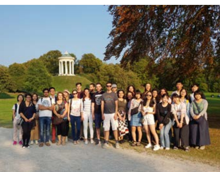
Kulturprogramm MISU Vor dem Monoptorus im Englischen Garten