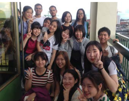
Kulturprogramm MISU Stadtführung in München