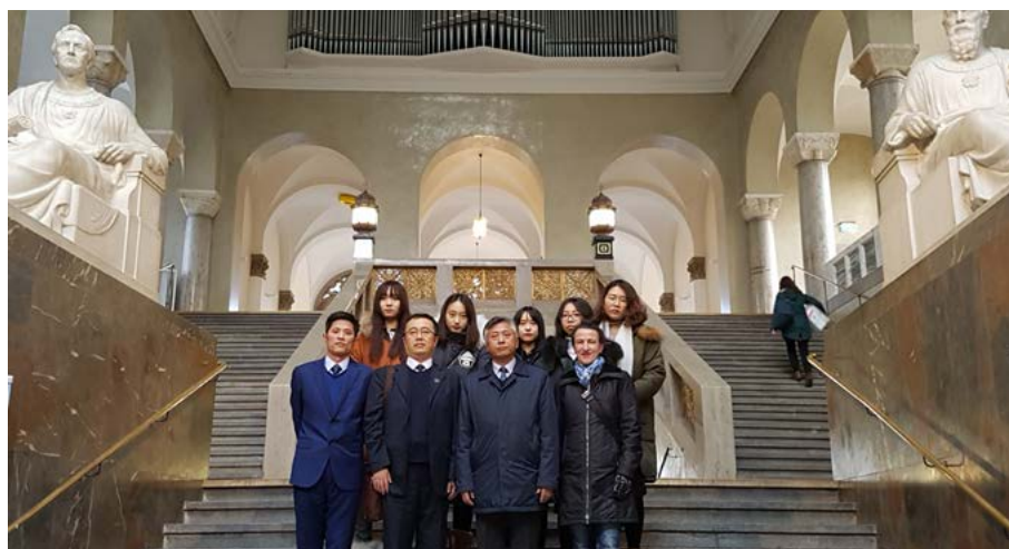
Changchun Normal University Delegation im Lichthof der LMU

Das große Interesse am Sprachprogramm der Deutschkurse zeigte sich auch in den Besuchen zweier Delegationen von chinesischen Partneruniversitäten. Vertreter der China University of Petroleum in Qingdao, an der einmal jährlich eine Fern-DSH durchgeführt wird, statteten unserem Institut im August einen Besuch ab. Im November war eine Delegation der Changchun Normal University, die im Rahmen eines Langzeitprogramms ihre Studierenden zu den Deutschkursen schickt, in München zu Gast.