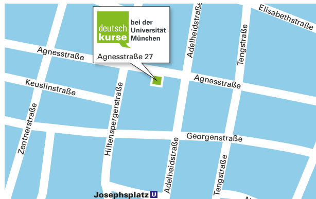
Agnesstraße 27, 80798 München